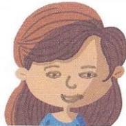
les éléments du visage