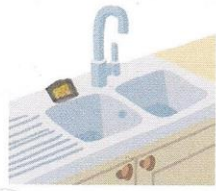
une éponge sur l'évier