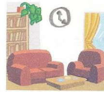
une horloge dans le salon