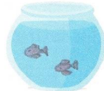
deux poissons rouges dans le bocal